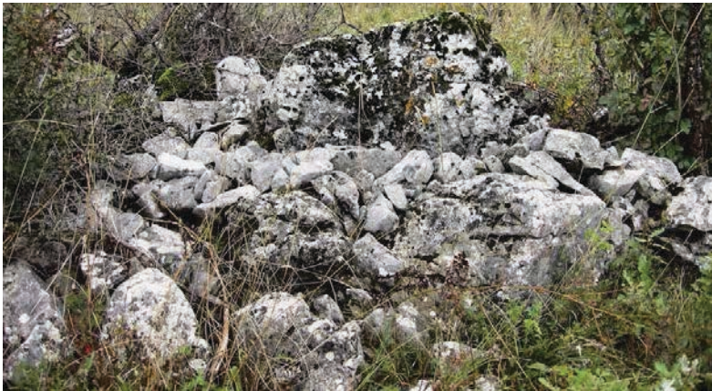
Сл. 10. Гробна томила у нейосредној близини куће Јаковића у Рудинама код Билеће (Вољице-Корића). У иїјемџу томиле лежи усађен билеї (1,10 м) који означава гроб иредсїављен сїицїеном доїремљеном из околине која има форму нейравилної сандука. Неиїшо круїнији комади кречњака леже усађени у земљу у иериферном виїенцу идоуїирући и обезбјеђујући консїрукцију.