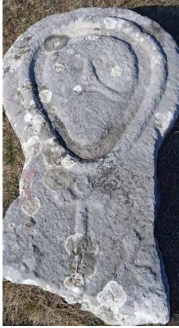
Сл. 9. Тийска иредсїава Хрисїа на крсним сїоменицима Невесиња. Овдје: Кифино село.