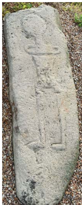
Сл. 3. Фиџурална предсјава на надгробној илочи.