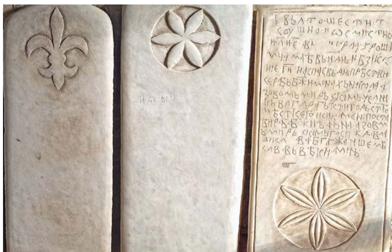
Сл. 4. Предсјава крина на једној од илочи.