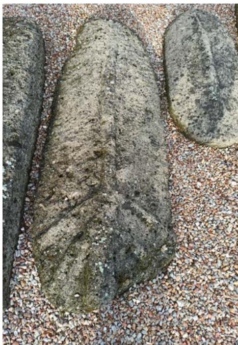
Сл. 2. Сандук са заобљеним хрбајом у сјајаром гробљу села Дићи.