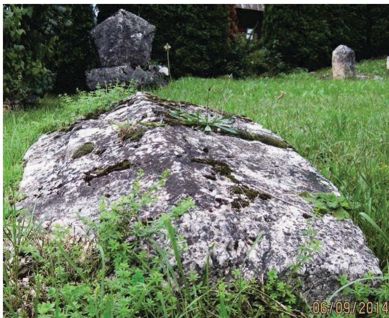
Сл. 7. Некројола у Мокрој Гори (Србија). Ниски сљемењаџи се налазе у сџарим некројолама Србије и у зајадним дјеловима земље и у дубини земље. Тако: Село Дићи код Љија, Љуљаџ (Дежева) код Новој Пазара... Ове некројоле нису јомињане у обимној синџези Ш. Бешлајића, Сџећџи..., 1971.