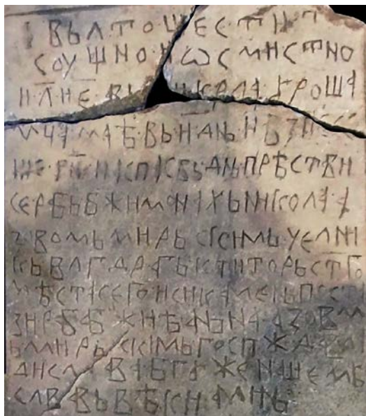
Сл. 1. Најстарији у Дићима.

У вези са поменутиим мишљењима о карактеру гробних плоча из одређених дјелова Србије у којима се препознаје "протостећак", сасвим је на темељу наших многобројних теренских увида на просторима Херцеговине извијесно да се древни гробни биљези јако озбиљних димензија могу видјети и тамо. Везани су каткада за гробне гомиле, а споменици типа сандука са заобљених хрбатом припадају најстаријем слоју у оквиру индустрије стећка (сл. 10 и 11).