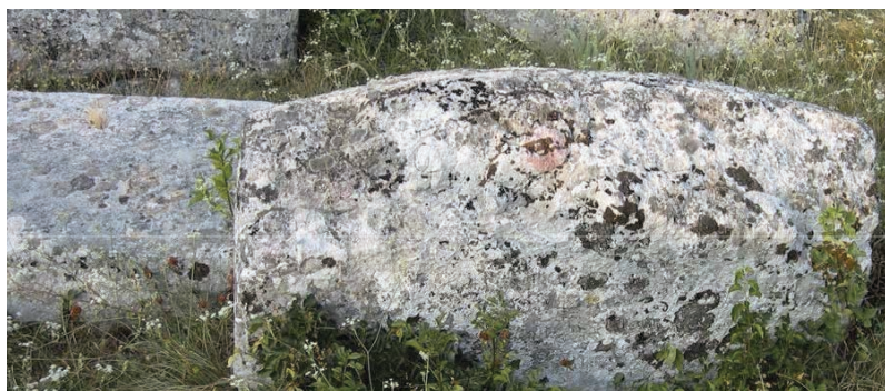
Сл. 8. Сљемењаџ са заобљеним хрбајом у јробљу у Лукову код Никшића. Некројоле никшићке обласџи су сџаре и често чувају врло рејрезенџајџивне сјоменике: Ријечани на јлајоу код школе, Брођанаџ у јорџи цркве Св. Ајосџола Луке, Велимље у јорџи Саборне цркве Св. Арханјела Михаила, Враћеновићи у Ојујиној рудини – јлавна некројола и Кленак – јлавна некројола.