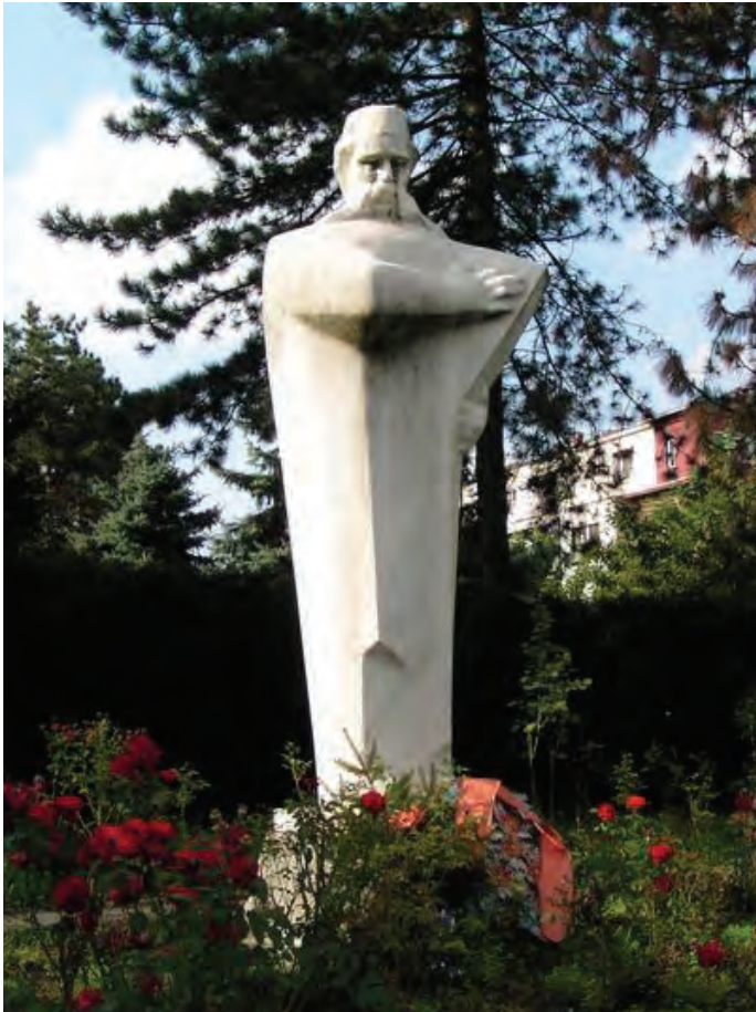
Споменик у Лозници

(Љуб. Стојановић., Живот и рад Вука Стеф. Карацића, Штампарија графичког завода „Макарије“ А. Д. Београд-Земун, 1924)