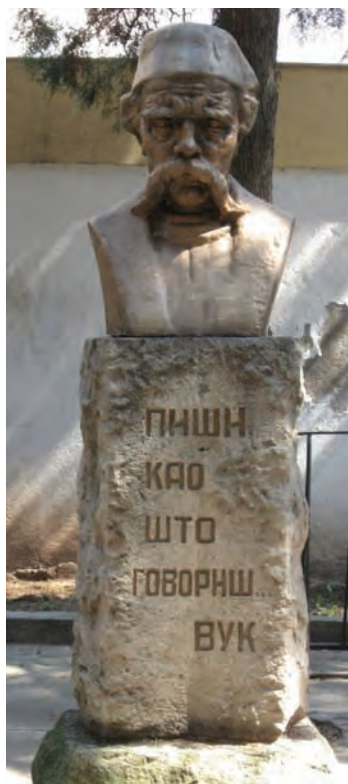
Сјоменик у Нишу

[Јован Кашић, О Српском рјечнику из 1852. године. Из историје књиге, поговор издању Српски рјечник (1852) , Београд, Просвјета, 1964]