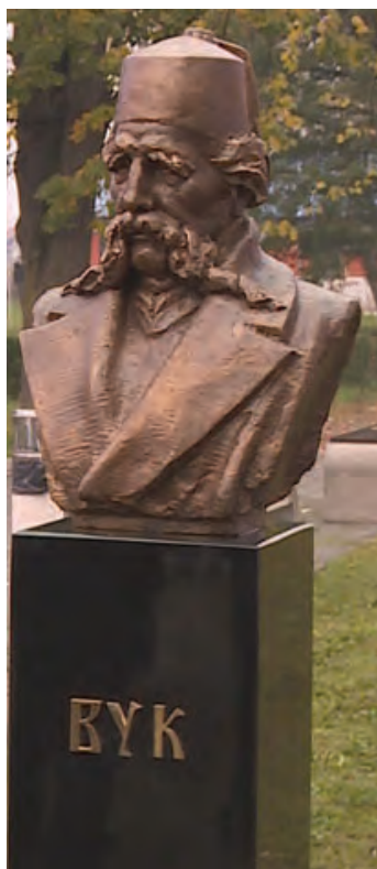
Сјоменик у Бањалуци