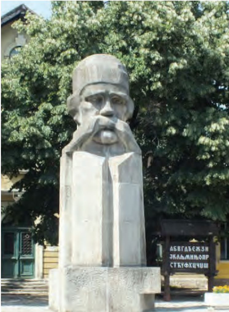
Сјоменик у Ваљеву

Кључне ријечи: сложенице, сраслице, ријечи са двије основе, композиција, комбинована творба, извођење, префикс, суфикс, интерфикс, лексичко значење, фреквенција.