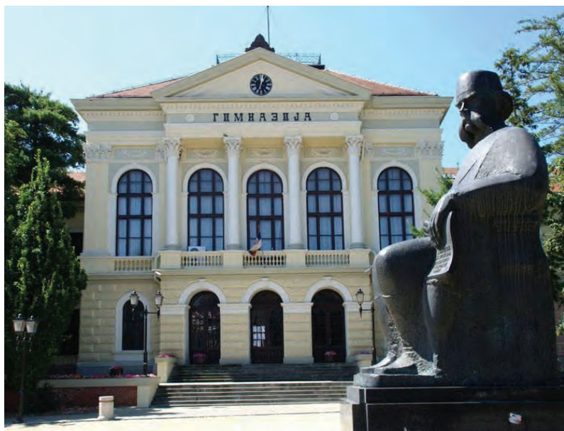
Споменик Вуку испред Прве крајујевачке гимназије (основана 1833)

(Љуб. Стојановић., Живот и рад Вука Стеф. Карацића, Штампарија графичког завода „Макарије“ А. Д. Београд-Земун, 1924)