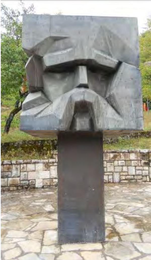
Споменик у Пејњици код Шавника (Вукови коријени)

Ако желите јоште што више знати, а Ви ми пишете шта желите знати.