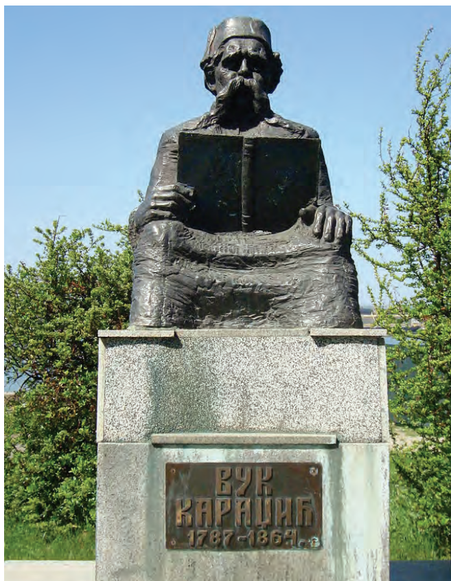
Споменик у Кладову