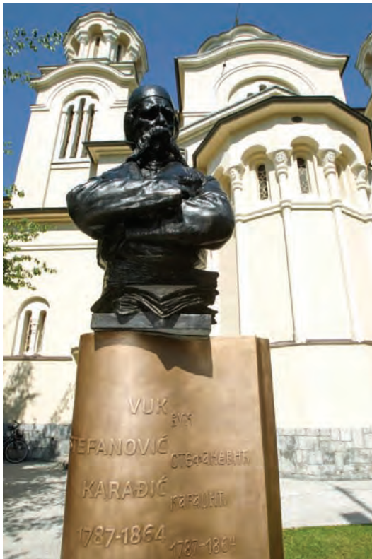
Сјоменик у Љубљани

Шипка 2011 - Шипка Данко, Речник ојсцених речи и израза , Прометеј и Корнет, Нови Сад, Београд, 2011