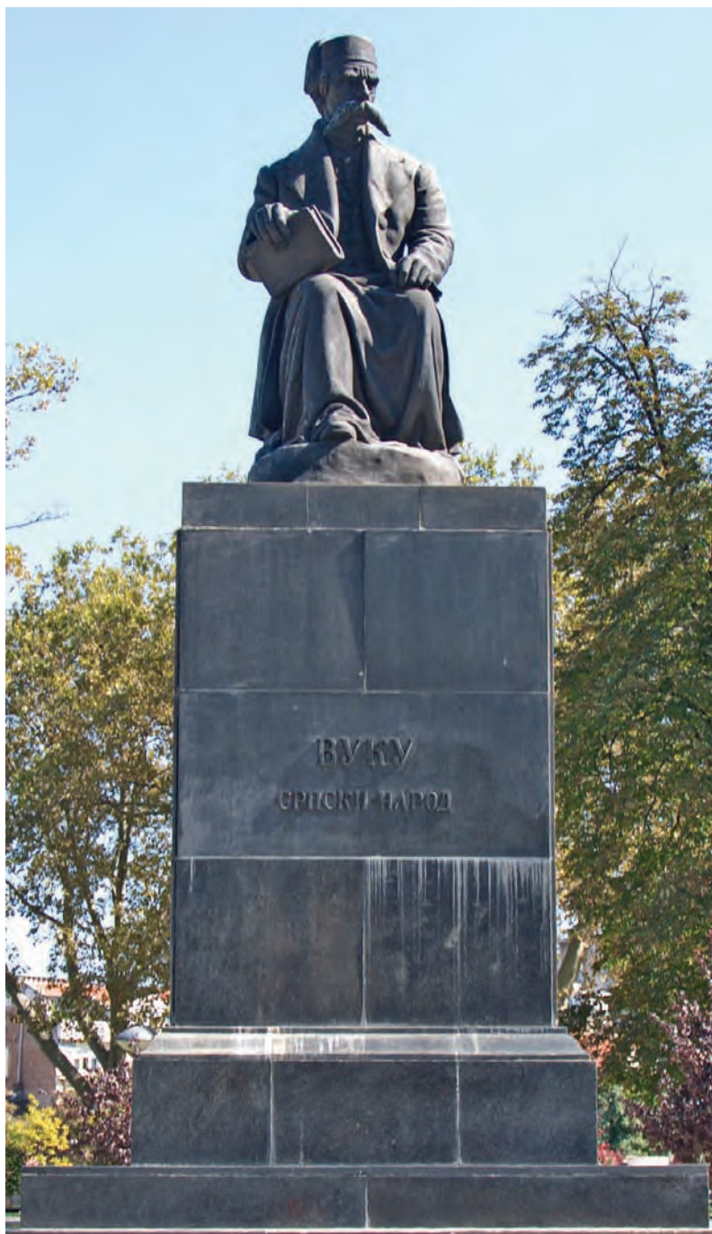
Сјоменик у Београду