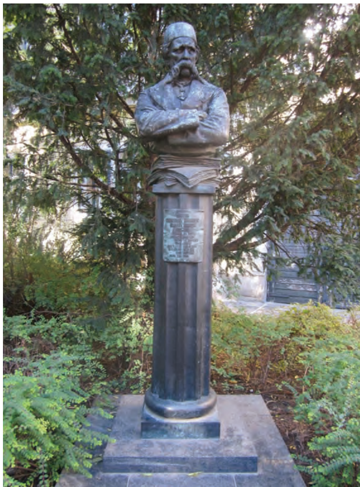
Сјоменик у Бечу

трумент грађанској класи да се културно изрази, он је поставио и основ за њену књижевност“, каже Милан Богдановић за Вука, али је од те чињенице занимљивије да је тој књижевности Вук оставио дух свога Рјечника , своју бунтовну сељачку оријентацију из времена устанка, конкретност мишљења, везаност за видљиви свет, одсуство жеље и смисла за елевацију, за снове и за тајанство. Дао јој је антејску снагу, али је није пуштао да сувише високо лети. Можда зато у XIX веку постоји низ добрих писаца, али само један Његош.