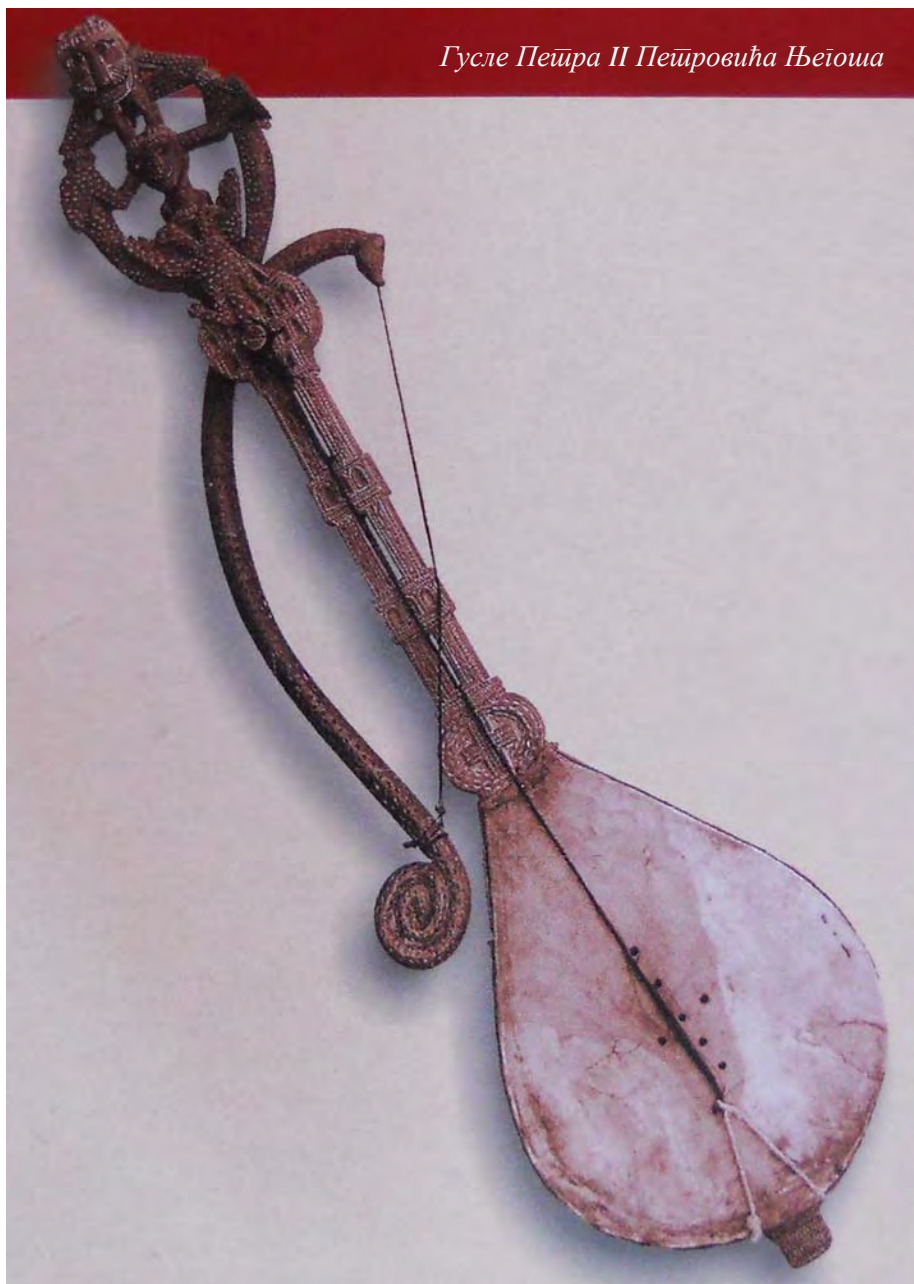
Гусле Петра II Петровича Негоша