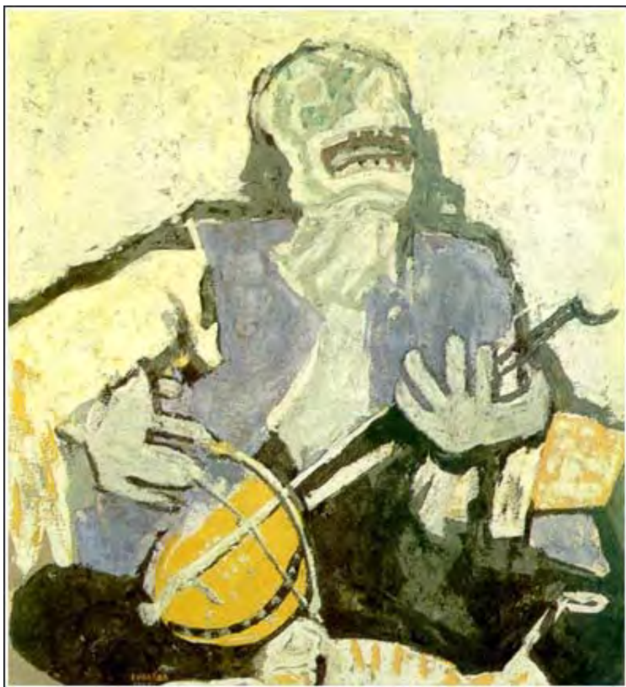
Петар Лубарда: Гуслар