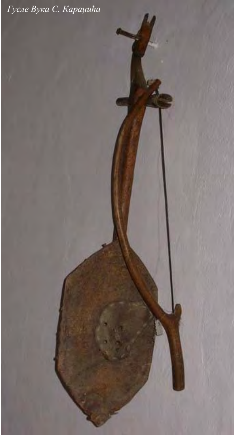
Гусле Вука С. Караџића