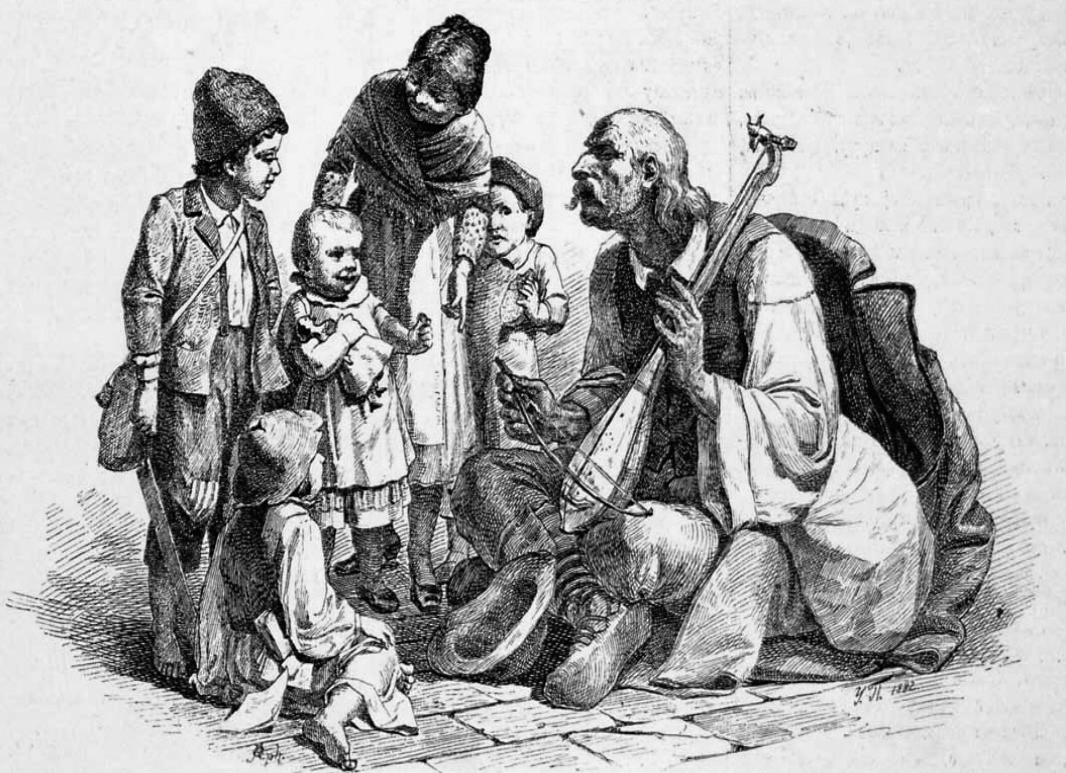
Српчад око гуслара. Студија Уроша Предића академ. сликара у Бечу.