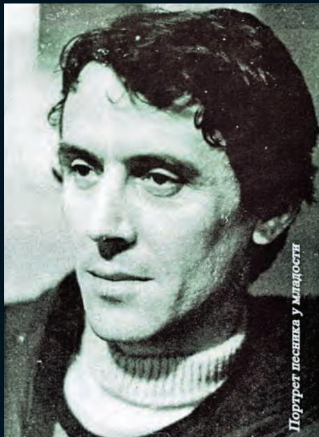
Портрет песника у младости